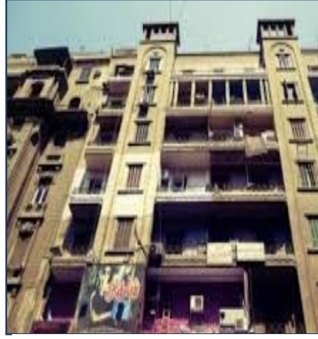
عمارة يعقوبيان - ٣٤ شارع طلعت حرب - وسط القاهرة

مقارنة بين العنوان وصورة الغلاف في الروائيتين