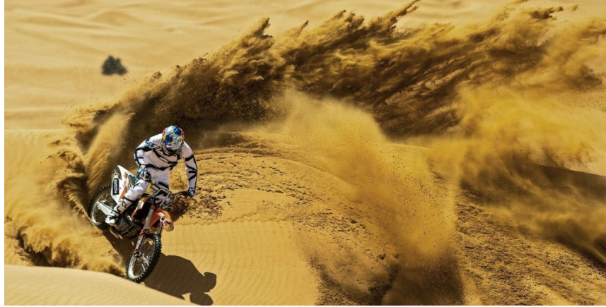
صورة (٧) احدى الرياضات فى مدينة الرياض