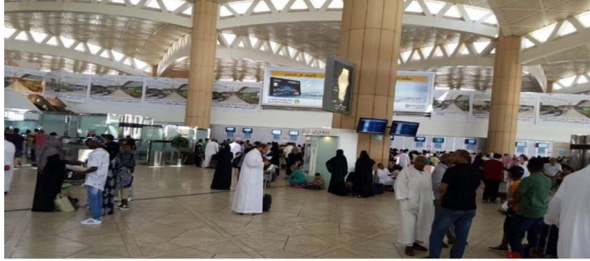
صورة (٣) تطوير الصالة الخامسة بمطار الملك خالد الدولي

ج- الرحلات المغادرة من الرياض (مطار الملك خالد الدولي): يغادر يوميا رحلات من مطار الرياض العديد من الرحلات والمتجهة من منطقة السياحة الى مدن السياح الاصلية فهناك العديد من الرحلات التي تتجه من مطار الملك خالد الى المطارات التالية: