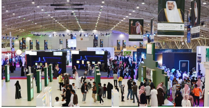
صورة (٦) احدى الشركات التجارية في مدينة الرياض

الاقتصادي بالمملكة ككل وزيادة الاهتمام بمنطقة الرياض بشكل خاص لوقوع عاصمة الدولة ضمن نطاقها يزيد من فرص الاستثمار فيها، فالمنطقة مجهزة بمجموعة من مراكز الأعمال المتطورة، والمناطق الصناعية، والبنية التحتية المتقدمة، وشبكة عصرية من الطرق، والاتصالات المتطورة، إضافة إلى مطارات دولية ومحلية تضاهي أرقى المطارات العالمية، كذلك تشمل على العديد من مراكز المؤتمرات والفنادق الرائدة المؤهلة لاستضافة الفعاليات الدولية والمحلية، مدعمة بطواقم عمل تتميز بالكفاءة والخبرة الطويلة في هذا المجال، لذلك فإن الرياض وجهة مثالية لرجال الأعمال.