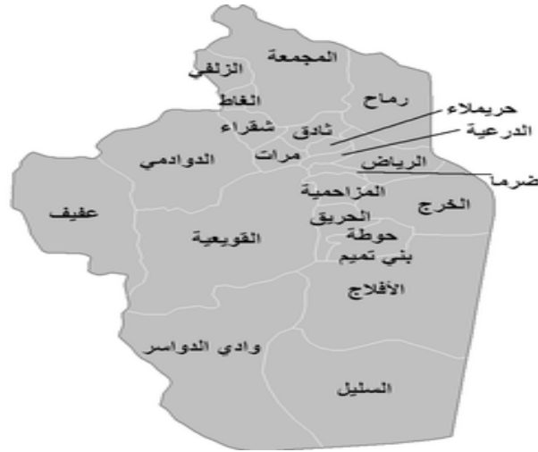
شكل (١) التقسيم الإداري لمحافظة الرياض

وتتميز مدينة الرياض بأنها مقر الحكم والادارة واكبر مراكز البلاد الحضريّة ومع خصائصها الطبيعية واتساع مساحتها الا انها تعتبر من المنظور الجغرافي والتاريخي اقليما متماثلا في خصائصه وسماته وتضم مدينة الرياض قصر الحكم الذي يمثل الانطلاقة الحقيقية لكل ملوك المملكة ويمثل قصر الحكم التاريخ والتراث العمراني القديم لمنطقة الرياض. ومن الاثار والاماكن التاريخية في منطقة الرياض بالاضافة الى قصر الحكم (قصر المصمك) وقصر المربع وقصر عفيف وقصر الشميسي وحى الطريف وبرج منفوحة وتنقسم محافظة الرياض الى سبعة اقسام ادارية هي (مدينة الرياض- مركز عرقله- مركز الحائر- مركز هيت- مركز بنبان- مركز العماجية- مركز ديبان) شكل (١)