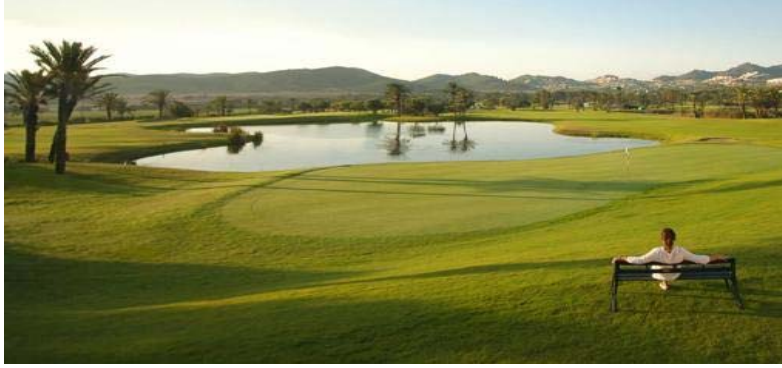
صورة (٨) منطقة زراعية في مدينة الرياض