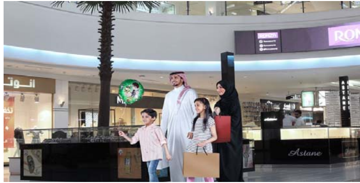
صورة (٩) احد المولات في مدينة الرياض

في مراكز الرياض التجارية الفخمة وأسواقها التقليدية ومتاجرها الحديثة، يضمن المتسوقون اكتشاف كل ما هو جديد وفريد ومتميز. لقد تطورت تلك المراكز المنتشرة في جميع محافظات الرياض لتصبح وجهات للتسوية والترفيه، تقدم خلالها تجربة رائعة تخطف أبصار وأذواق جميع الزائرين. كما تعد مهرجانات التسوق في الرياض باختلاف أنواعها مثل مهرجان الرياض للتسوق، ومهرجان تمر الخرج، الوجهة المحببة إلى قلوب جميع عشاق التسوق. كما أن أسواق المنطقة التقليدية تلبى رغبات وتطلعات الباحثين عن التراث والحلي والذهب والملابس التقليدية، والأقمشة، والأعمال اليدوية. فتجربة تسوق واحدة في الرياض ستعيش معها مغامرة لا تنسى في واحة من أشهر الماركات العالمية والمحلات الكبرى بأسعار مغرية