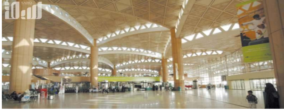
صورة (٢) ساحة مطار الملك خالد الدولي

وبيّنت الاحصائيات أن ٣٧ شركة ناقلة ساهمت في نقل الركاب لمطار الملك خالد في الرياض من ٩١ وجهة سفر وتجدر الإشارة إلى أن الهيئة العامة للطيران المدني تعمل على تطوير مطار الملك خالد الدولي ليكون وحدة مستقلة وفق معايير تنافسية للارتقاء بالخدمات المقدمة للعملاء من المسافرين وشركات الطيران ومرتادي مرافق المطار كافة.