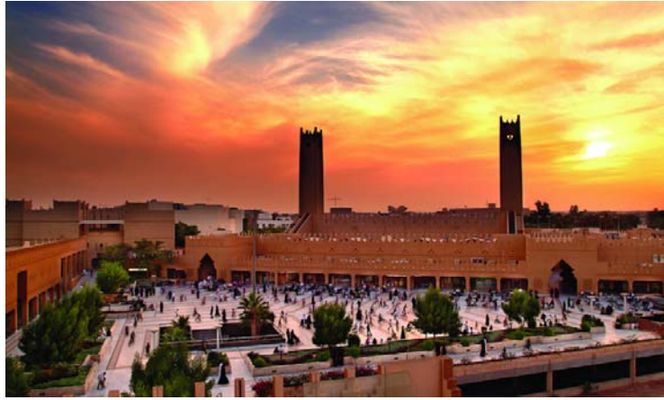
صورة (٤) إحدى المناطق التاريخية في مدينة الرياض

تُعتبر الرياض واحدة من أغنى مناطق المملكة العربية السعودية ثقافيًا وتاريخيًا، إذ أنها تجمع عددًا كبيرًا من المعالم التي يعود بعضها إلى العصور الحجرية القديمة مثل قرية الفاو التاريخية، وآثار البجادية، وموقع الثمامة الأثري، وأخرى إلى العصور الحديثة، مثل القصور، والمدن التاريخية مثل الدرعية التاريخية التي تم ضمها إلى مواقع التراث العالمي من قبل منظمة اليونسكو، إلى جانب المتاحف والقرى التراثية الشاهدة علي حضارة وعراقة تلك المنطقة، حيث يضم المتحف الوطني السعودي في جنباته العديد من التحف والآثار التاريخية التي تعرض تاريخ الحضارات القديمة في المنطقة بشكل خاص والمملكة بشكل عام، إلى جانب قاعت تعرض لتاريخ المملكة العربية السعودية منذ قديم الزمان إلى اليوم.