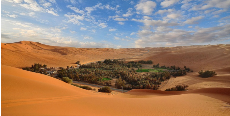
صورة (٥) احدى صحارى مدينة الرياض

صحراء منطقة الرياض هي ليست ذلك الجذب الذي طويلا ما الصُق بعقول وأذهان الناس؛ إنها موطن حضارة، وحكاية تاريخ، وإبداع الخالق، يستحق أن يعرف وأن يغوص الإنسان في جوهره، هي عالم مفتوح يدعوك إليه لتكتشفه وتنطلق بحرية في أجواءه التي تحملك إلى عالم فريد من المتعة والمغامرة. فزائر الرياض وعند تبدأ سيارات الدفع الرباعي تهتز قليلا إيذانا بدخولها صحراء الرياض الشاسعة سيشعر بدفعها من الشفاء والخياف، كما سيرى العديد من المناظر الطبيعية المتنوعة، والتضاريس المختلفة من جبال وهضاب وأودية وكثبان رملية ذات أشكال وألوان متعددة، ليمارس فيها العديد من الأنشطة والمغامرات. يعيش معها زائر المدينة مغامرة جريئة مملوءة بالمتعة والمرح والتشويق.